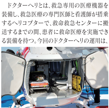
▲スムーズな患者の収容が可能な、キャビン後部に設けられたクラムシェルドア

熊本赤十字病院(熊本市長嶺南2丁目)が事業主体となるドクターヘリが、1月16日から運用を開始した。